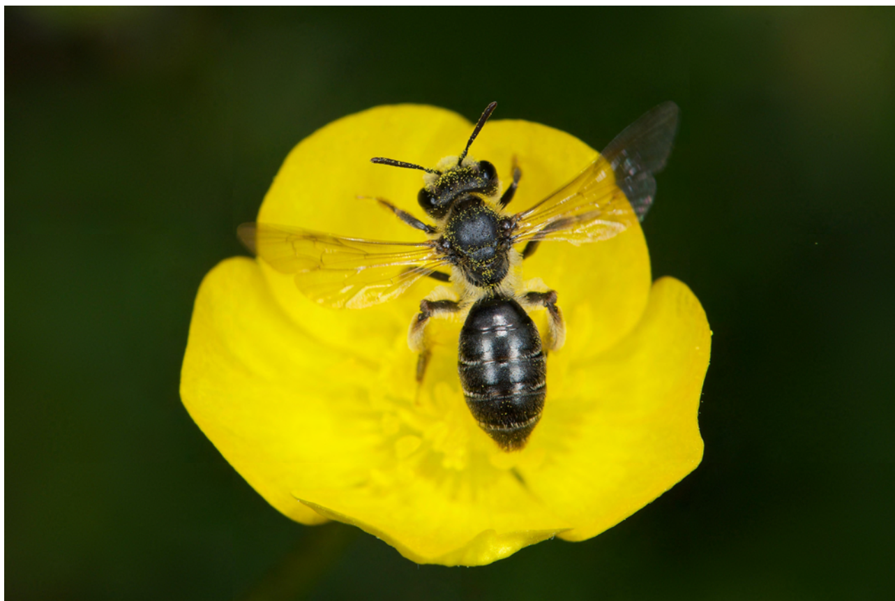
FIGURE 4. Les femelles de l'andrène des renoncules, Andrena ranunculi (Andrenidae) sont oligolectiques : ne récoltent du pollen que sur certaines plantes particulières, ici les renoncules.

de plantes (Cane & Sipes 2006; Müller & Kuhlmann 2008). L'abeille domestique est l'espèce la plus largement polylectique d'Europe puisqu'elle peut récolter localement du pollen sur des plantes de plusieurs dizaines de familles botaniques, y compris de nombreuses espèces introduites ou pollinisées par le vent comme le châtaignier, le chêne ou le maïs. Ainsi, en analysant, au sein d'un paysage de grandes cultures (Deux-Sèvres, France) et pendant cinq années consécutives, les ressources ramenées à la ruche, Requier et al. (2015) ont mis en évidence que les colonies étudiées ont ramené du pollen issu de 228 espèces différentes (sur ce thème, voir aussi le projet FlorApis, http://www.florapis.org/ ). Même si une ouvrière de l'abeille domestique ne visite généralement qu'un type de fleurs en se spécialisant par exemple sur un type donné de morphologie florale, toutes les butineuses d'une même colonie ne visitent pas les mêmes espèces végétales. Il en résulte que même si une espèce florale visitée par l'abeille domestique domine, les espèces florales moins abondantes localement seront aussi visitées par d'autres ouvrières. Si l'on excepte les fleurs à corolle profonde qui ne peuvent être visitées que par les insectes qui ont la langue assez longue comme les bourdons, le spectre alimentaire de l'abeille domestique recouvre donc largement celui de l'ensemble des abeilles sauvages, ces dernières ayant toutes un spectre alimentaire plus étroit (Thorp 1996).