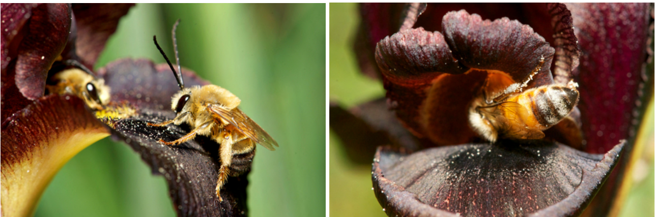
FIGURE 6. Iris atropurpurea est une plante adaptée à la pollinisation par les mâles d'abeilles sauvages (gauche, ici Synhalonia spectabilis , Apidae) qui s'y réfugient pour la nuit ou pendant les périodes d'intempéries. Là où les ruches sont installées, les ouvrières de l'abeille domestique récoltent activement du pollen pendant la journée, pollinisant les Iris par la même occasion, attirées par des motivations alimentaires (pollen) et non pas par la recherche d'un refuge nocturne. Ces différences de "motivations sensorielles" qui peuvent se traduire par de la pollinisation efficace peuvent entraîner des différences de régimes de sélection et donc influencer l'évolution phénotypique des plantes si l'activité apicole se maintient au sein ou à proximité des populations d' Iris atropurpurea .

A ce jour, il existe un nombre limité de travaux portant sur la perturbation des communautés végétales en liaison avec l'installation de ruches. Si l'installation de ruches de l'abeille domestique peut effectivement augmenter la fréquence des visites florales par les ouvrières, ce qui soit dit en passant peut notamment favoriser l'installation locale d'espèces invasives (voir p.ex. l'effet sur Lythrum salicaria en Amérique du Nord: Mal et al. 1992; Barthell et al. 2001), certaines études indiquent que les hautes densités d'abeilles peuvent également avoir un impact négatif sur le succès reproductif des plantes, notamment à cause du prélèvement important de pollen (Hargreaves et al. 2009), de nectar (Kenta et al. 2007), les dégâts occasionnés sur les fleurs (Dohzono et al. 2008) ou la perturbation des patrons de flux de pollen entre plantes impliquées dans des interactions hautement spécialisées avec les pollinisateurs sauvages (Vaughton 1996; Gross & Mackay 1998; Watts et al. 2012).