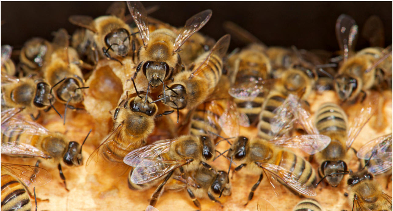
FIGURE 1. Ouvrières de l'abeille domestique ( Apis mellifera ) au coeur de la ruche.

Pour endiguer voire contrer le déclin des abeilles, certains acteurs (associations, syndicats apicoles, entreprises, etc.) préconisent l'installation et la multiplication des colonies (ruches) de l'abeille domestique ( Apis mellifera , FIGURE 1) dans les habitats (semi-) naturels, les réserves naturelles, ainsi que dans les villes ou dans les parcs industriels. Ces initiatives qui se répandent rapidement sont à l'origine d'une réflexion conduite au sein de l'Observatoire des Abeilles (OA, www.oabeilles.net ), une association de loi 1901 qui s'est donné pour mission l'étude de l'écologie et de la conservation des abeilles sauvages dans leurs habitats naturels. Notre expérience scientifique, notre connaissance des abeilles sauvages et de l'abeille domestique, nos nombreux échanges avec diverses associations naturalistes, des gestionnaires de milieux semi-naturels, des apiculteurs dont certains approuvent ce texte, et avec les médias nous ont encouragés à faire le point sur cette question et à proposer des pistes pour que cohabitent toujours en "bonne entente" Apis mellifera , l'espèce domestiquée, et ses cousines sauvages.