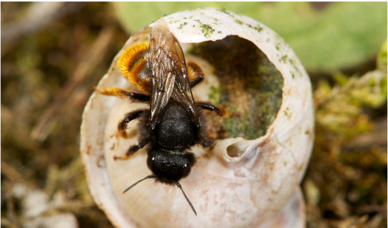
FIGURE 3. L'osmie bicolore ( Osmia bicolor , Megachilidae) fait partie des espèces d'abeilles sauvages à l'écologie très spécialisée : les femelles établissent leur nid (leur "gîte") exclusivement dans des coquilles d'escargots.

Le gîte. Contrairement à l'abeille domestique qui bénéficie du gîte assuré par l'apiculteur, les abeilles sauvages doivent trouver elles-mêmes les sites favorables pour nidifier. Certaines espèces font leurs nids avec des matériaux comme de la résine, des fragments de feuilles, des pétales de fleurs, de la boue, beaucoup creusent leur nid dans le sol alors que d'autres creusent le bois mort ou exploitent des coquilles vides d'escargots (FIGURE 3). Or, la faible surface des zones protégées, la régression massive des milieux "interstitiels" et des milieux refuges semi-naturels tels que les bordures des champs à proximité des prairies retournées régulièrement et amendées, a pour conséquence une diminution drastique des sites de nidification disponibles et des matériaux utilisés par de nombreuses espèces d'abeilles sauvages pour la construction de leur nid.